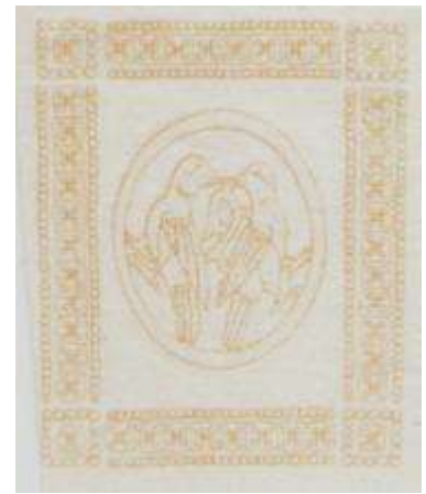
Tissu avant teinture